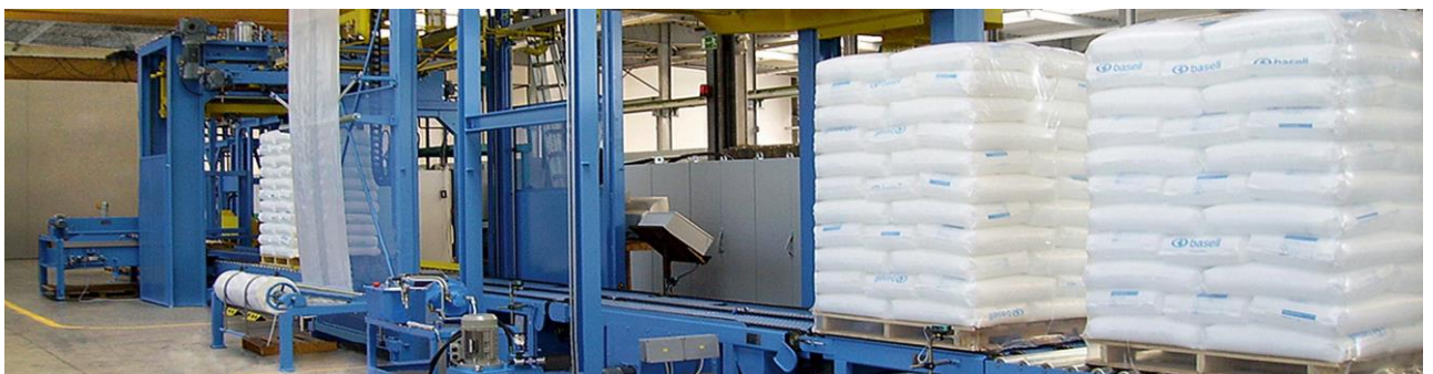
Side gusset shrink